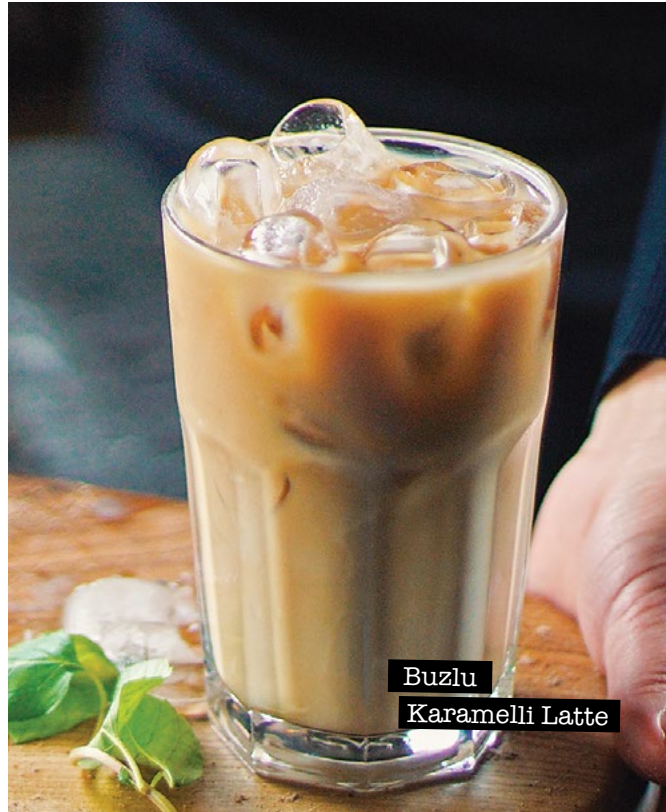
Buzlu Karamelli Latte