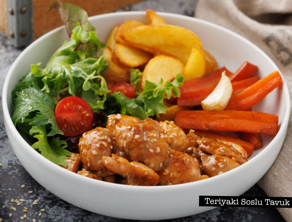
Teriyaki Soslu Tavuk