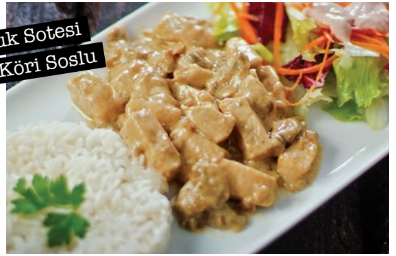
Şef'in Tavuk Sotesi Köri Soslu

'Tavuk but şiş, teriyaki sos, kavrulmuş susam, elma dilim patates, Ege salata karışımı, çeri domates, zeytinyağı - limon sosu ve fırında havuçlu garnitür ile'