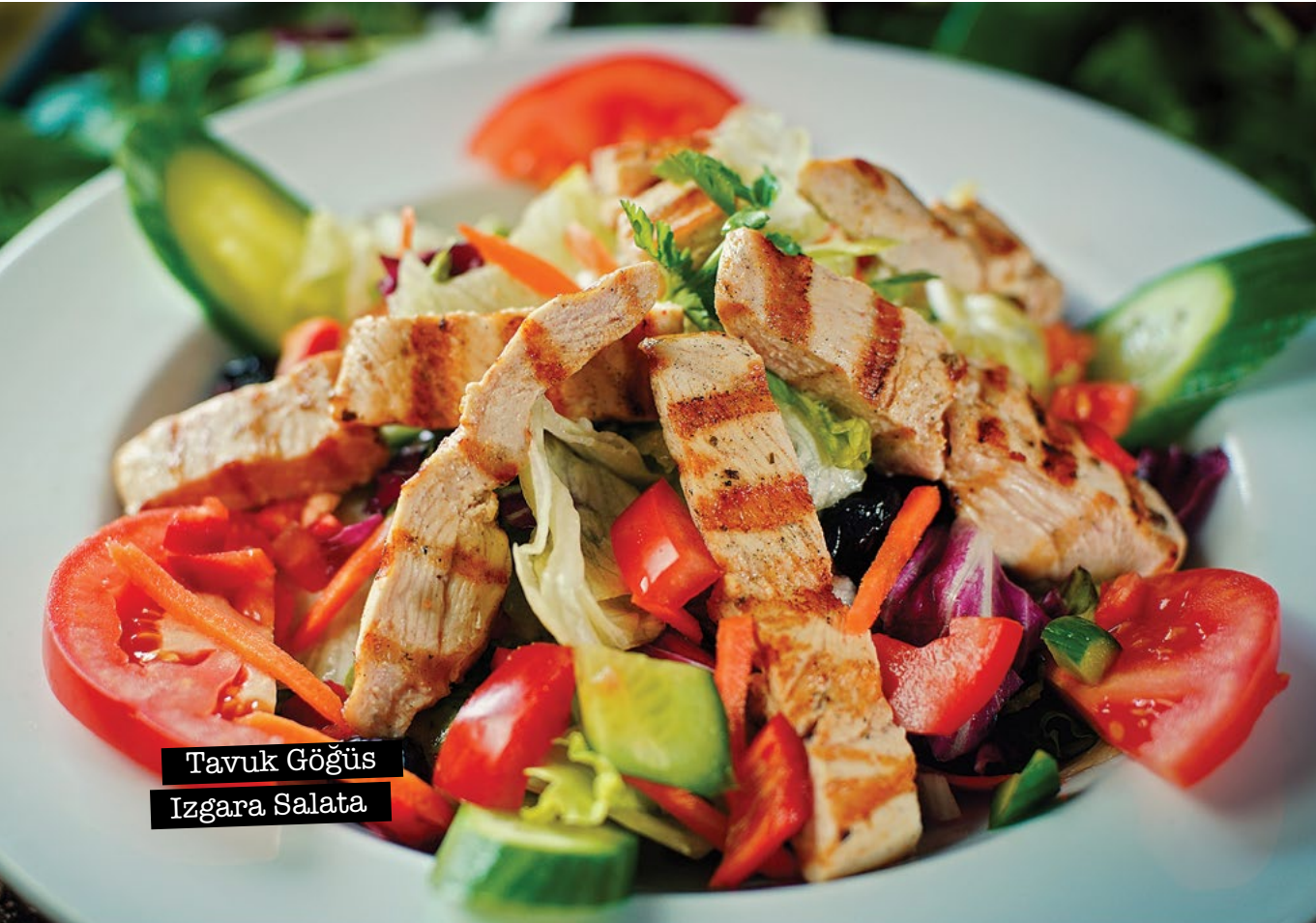
Tavuk Göğüs Izgara Salata