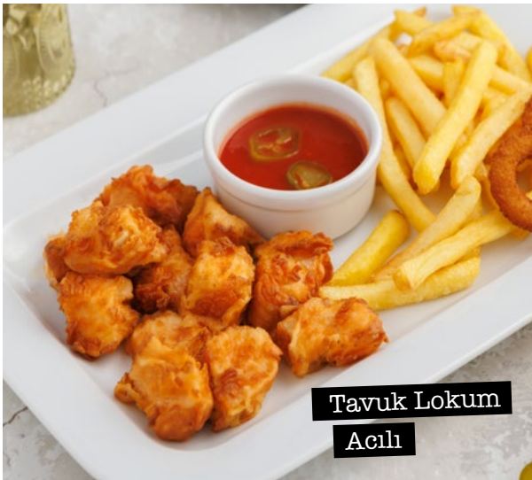
Tavuk Lokum Acılı