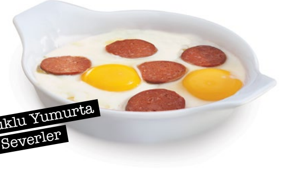
Sucuklu Yumurta Severler