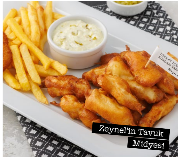
Zeynel'in Tavuk Midyesi