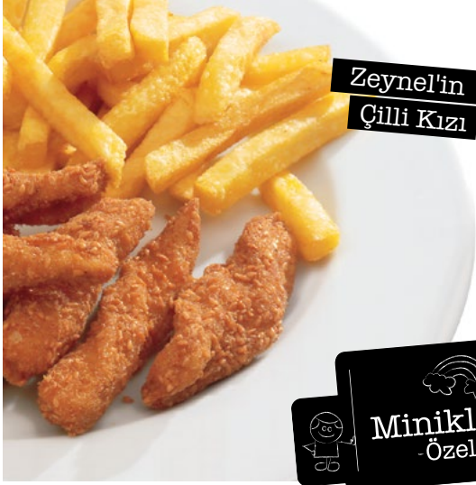
Zeynel'in Çilli Kızı