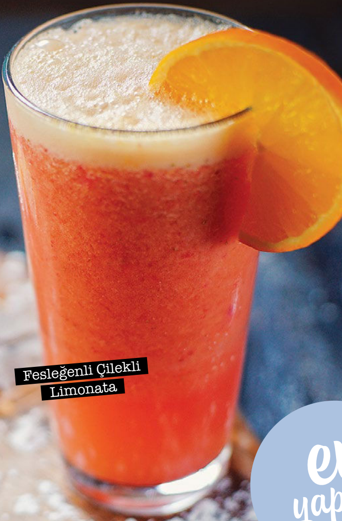
Fesleğenli Çilekli Limonata