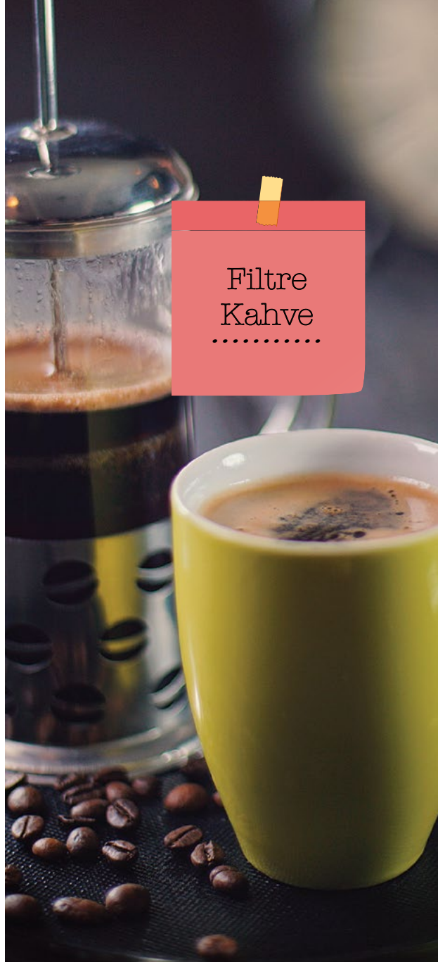
Filtre Kahve .....