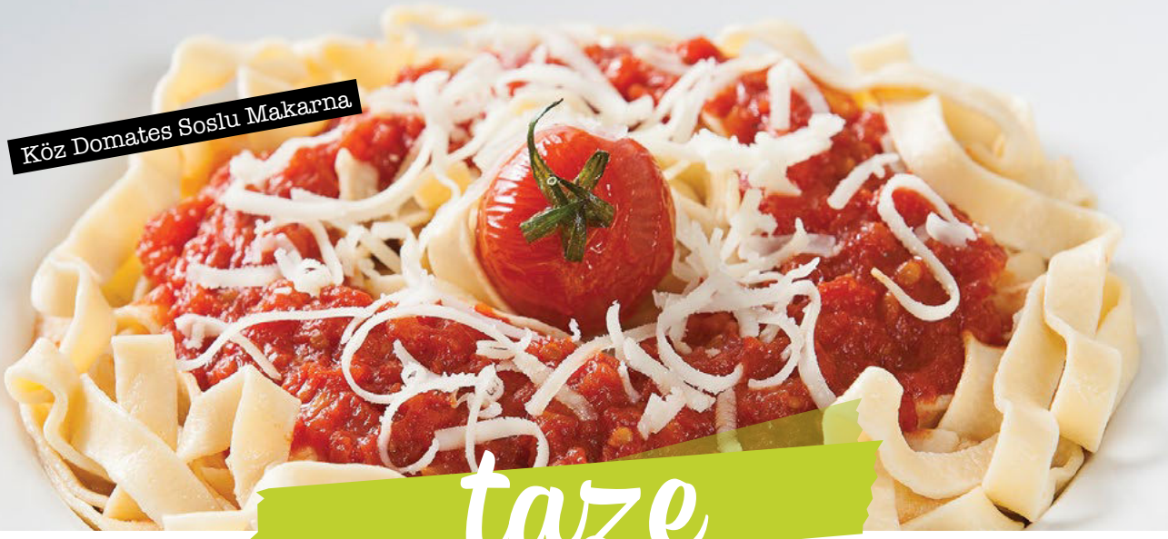
Köz Domates Soslu Makarna