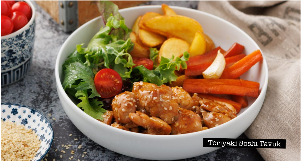
Teriyaki Soslu Tavuk