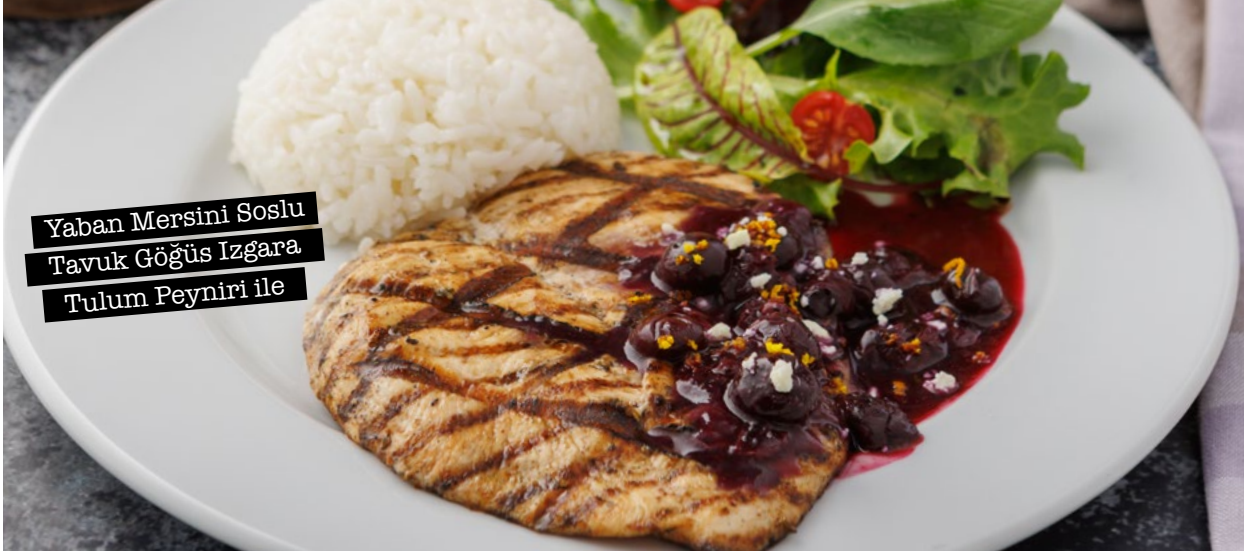
Yaban Mersini Soslu Tavuk Göğüs Izgara Tulum Peyniri ile

'Zeynel'in Çilli kızı, Zeynel'in tavuk midyesi, tavuk lokum, Çilli sos, hardal sos, acı sos ve patates kızartması ile'