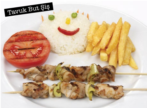
Tavuk But Şiş