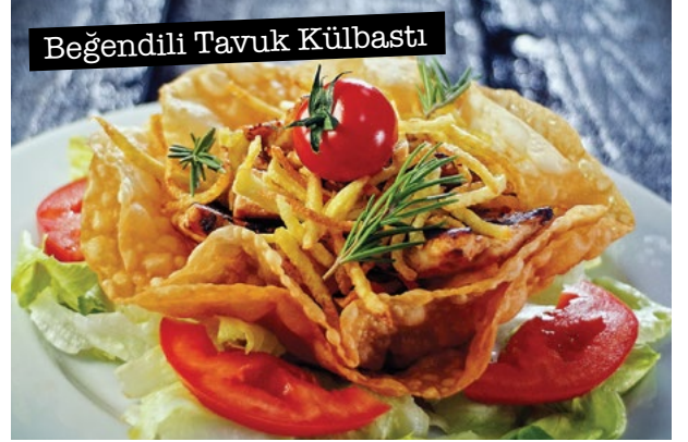
Beğendili Tavuk Külbastı