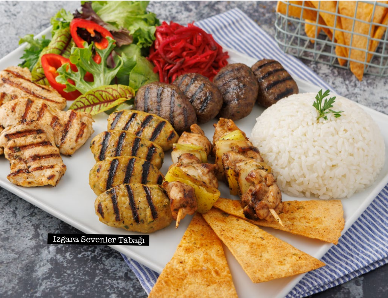
Izgara Sevenler Tabađı