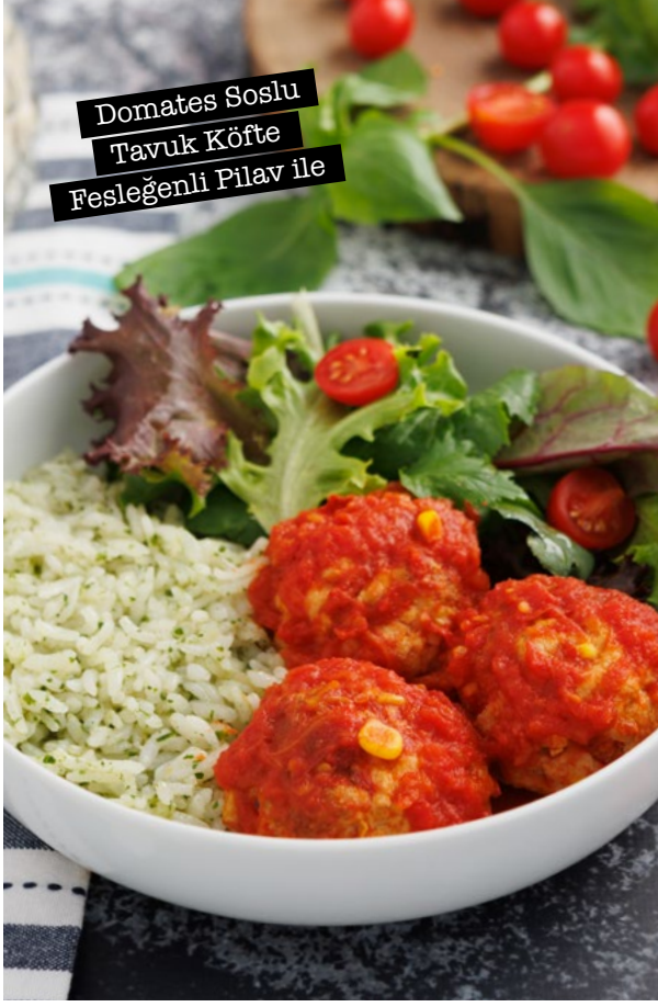
Domates Soslu Tavuk Köfte Fesleğenli Pilav ile