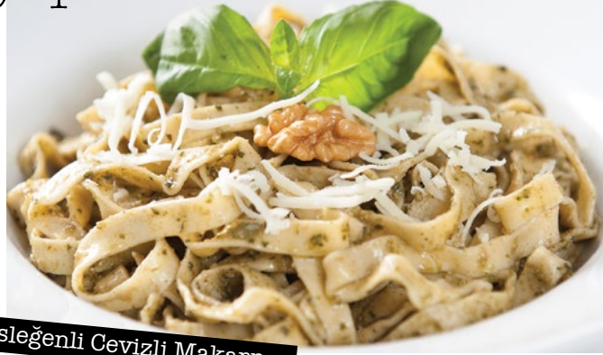
Fesleğenli Cevizli Makarna