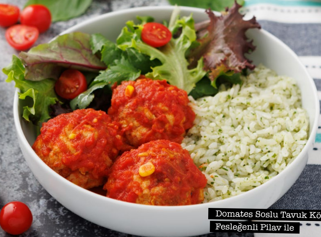
Domates Soslu Tavuk Köfte Fesleğenli Pilav ile