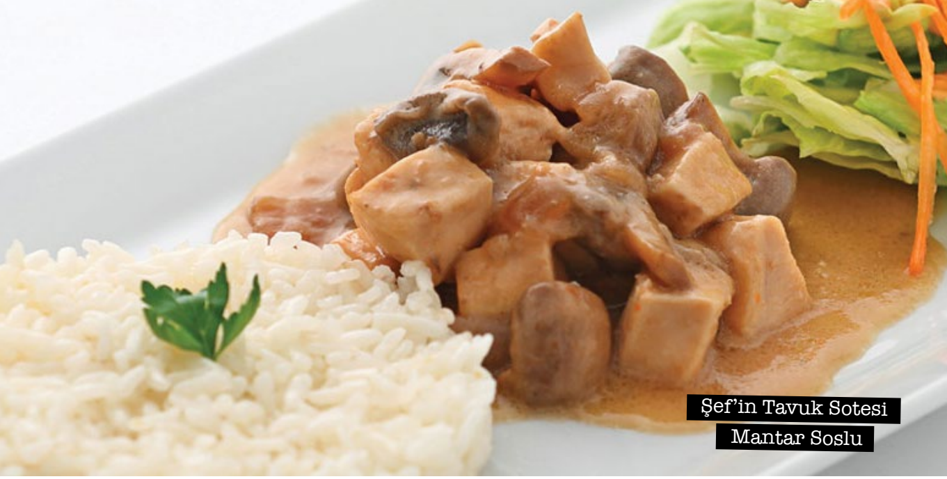
Şef'in Tavuk Sotesi Mantar Soslu