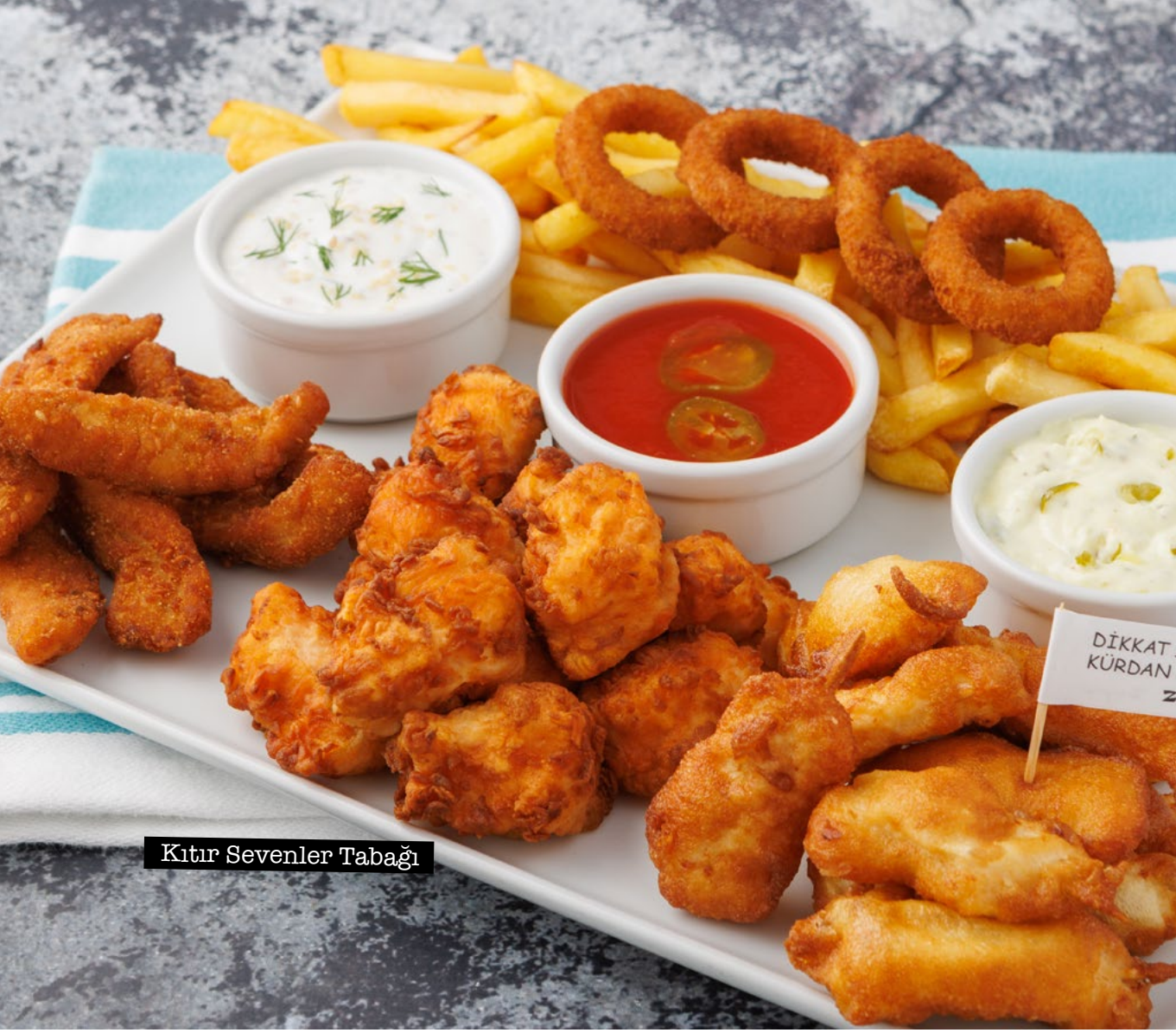
Ktır Sevenler Tabađı