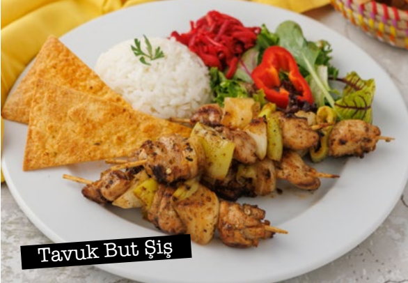
Tavuk But Şiş