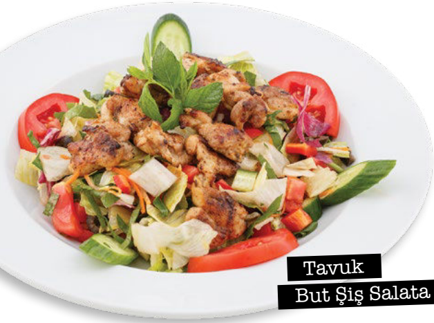
Tavuk But Şiş Salata

'Haşlanmış börülce ve nohut, mor lahana, kapy biber, yeşil biber, mevsim yeşillikleri, hardal sos'