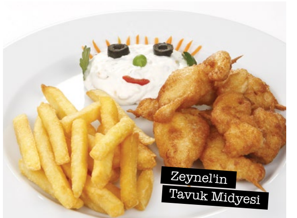
Zeynel'in Tavuk Midyesi