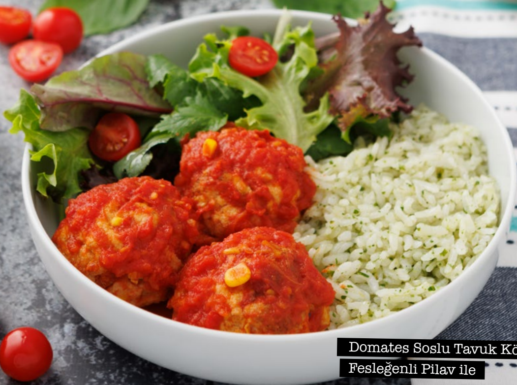
Domates Soslu Tavuk Köfte Fesleğenli Pilav ile