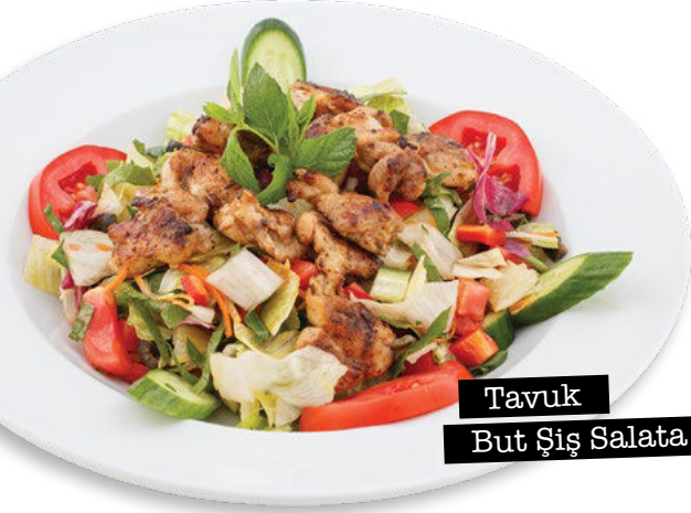
Tavuk But Şiş Salata

'Haşlanmış börülce ve nohut, mor lahana, kapyra biber, yeşil biber, mevsim yeşillikleri, hardal Sos'