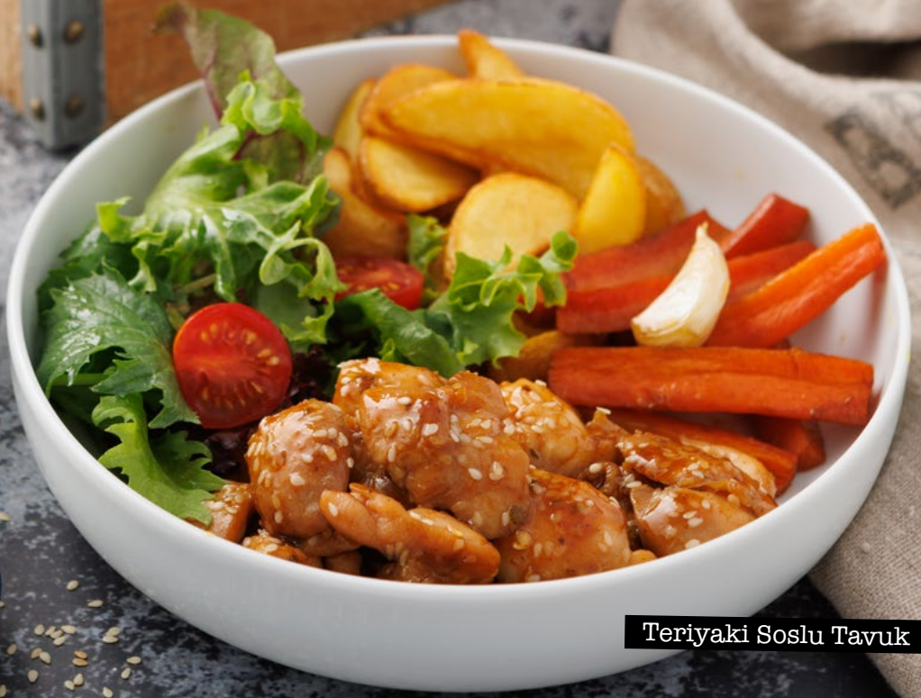
Teriyaki Soslu Tavuk