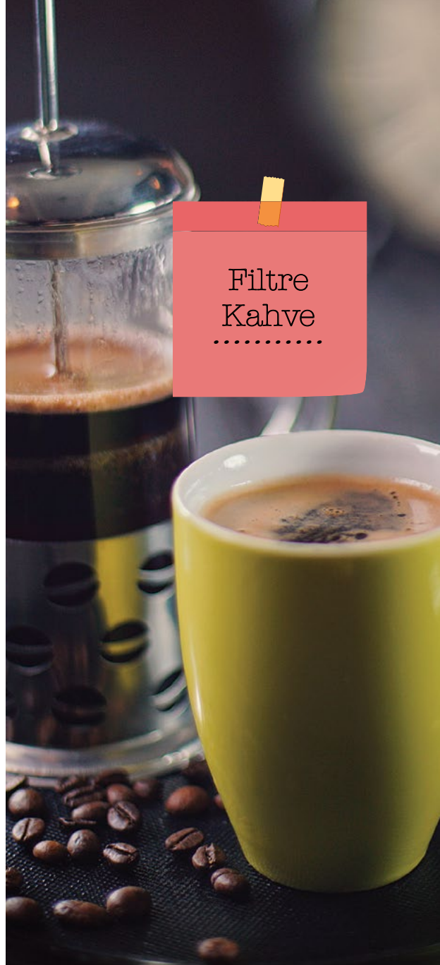
Filtre Kahve .....